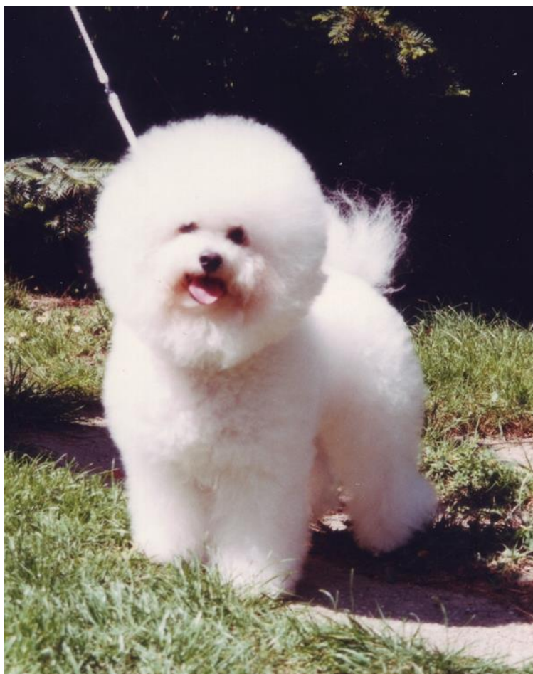
White Princ v. Trajanus

Vzhledem k tomu, že kolie trávily většinu času na zahradě, začala babička přemýšlet o menším plemeni, které by jí dělalo společnost v prázdném domě po smrti manžela. Náhodou se jí dostal do ruky zahraniční časopis se dvěma bišonky na titulní straně. Velmi ji zaujali a když měla zanedlouho možnost navštívit holandskou chovatelskou stanici v. Trajanus, chtěla je poznat naživo. Kromě smečky živých a přátelských bišonků tam viděla i roční vystrašenou fenku s kouzelným „kukučem“. Chovatelé vyprávěli, že byla bohužel ve špatných rukách a nedávno se vrátila zpět k nim. Babička se pak vrátila domů, ale smutné oči holandské fenky jí zkrátka nedaly spát. A tak se obratem jelo do Holandska znovu, a tentokrát malá fenka Romy přicestovala s babičkou do Prahy.