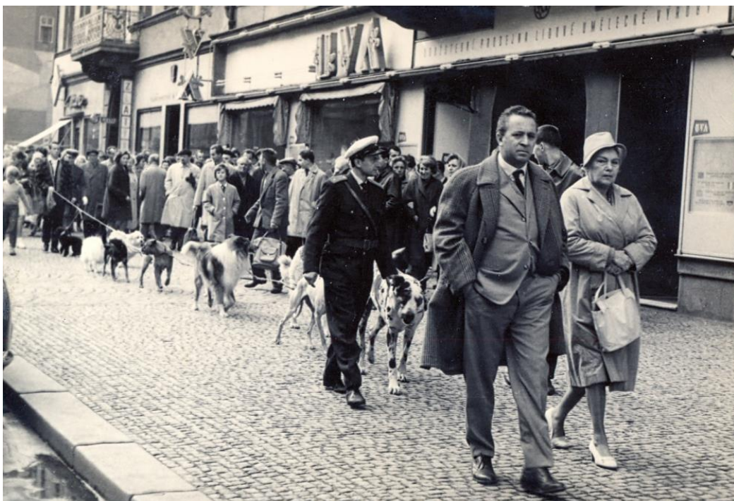
Landings of Ladypark ve filmu Táto, sežeň štěně z roku 1964