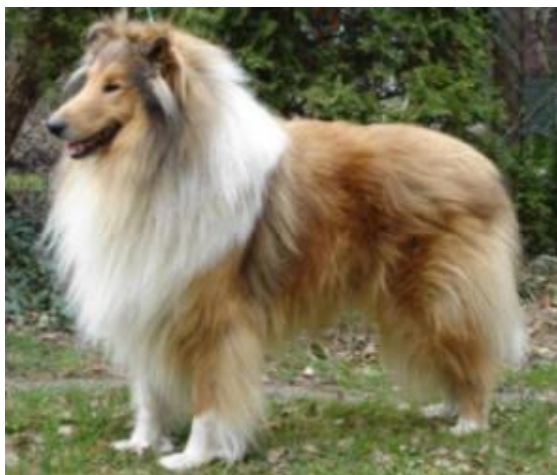
Sanssouci von Crottorf