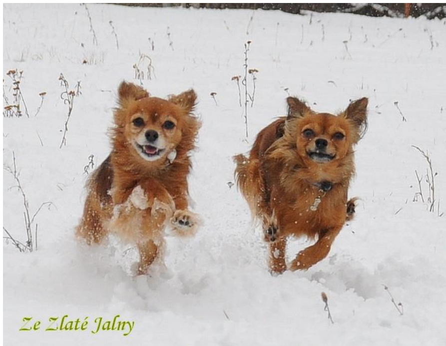
Ze Zlaté Jalmy